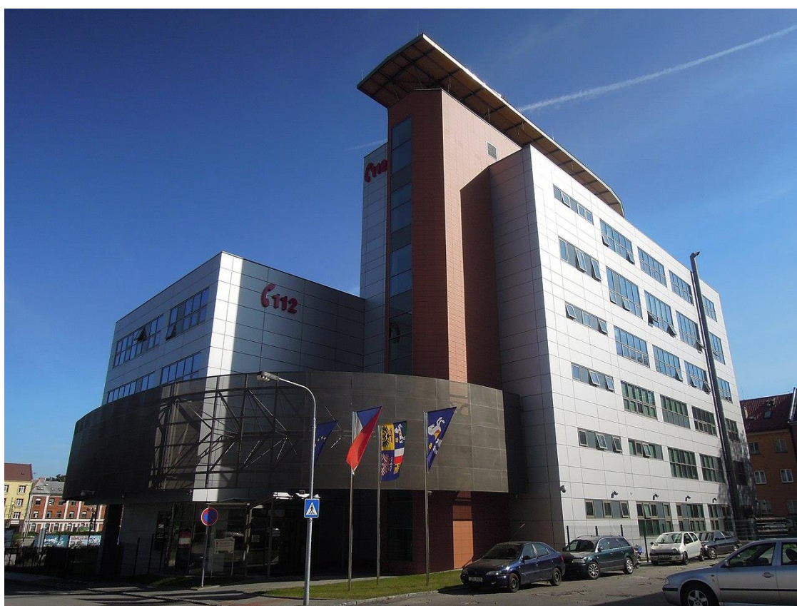
Obrázek 1- Integrované bezpečnostní centrum v Ostravě

Veškerá tísňová volání na telefonní čísla 150 a 112 jsou směrována na Integrované bezpečnostní centrum v Ostravě, které přijímá tísňová volání z celého Moravskoslezského kraje (dále jen „MSK“). V rámci tohoto centra působí Krajské operační a informační středisko Hasičského záchranného sboru Moravskoslezského kraje (dále jen „HZS MSK“), které dále provádí vysílání a následnou koordinaci všech profesionálních i dobrovolných jednotek požární ochrany v rámci řešení mimořádných událostí na území MSK.