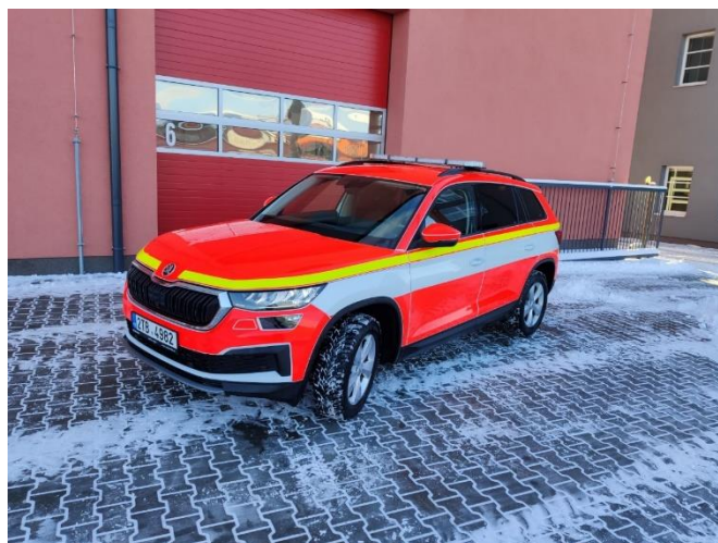
Obrázek 2 - Škoda Kodiaq 2,0 4x4