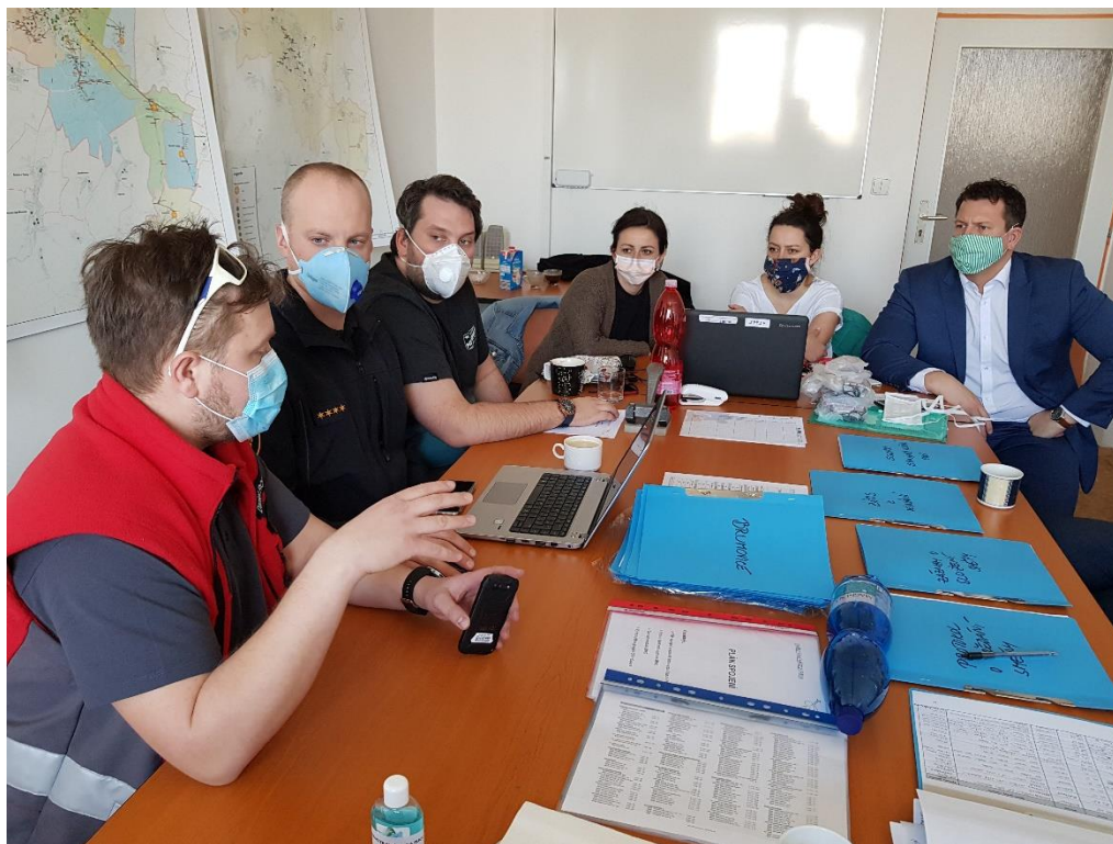
Obrázek 13 - činnost stálé pracovní skupiny krizového štábu

Bezpečnostní rada zasedala v tomto roce 18. 6. a 12. 11. 2021.