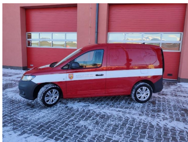
Obrázek 4 - VW Caddy Cargo 1,5 TSI