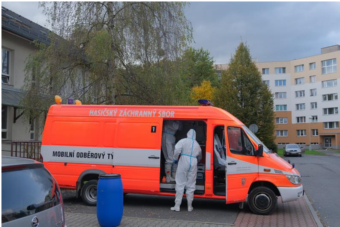
Obrázek 9 - mobilní odběrový tým HZS MSK

Nadále platí omezení osobního kontaktu zaměstnanců s veřejností na nezbytně nutnou úroveň s upřednostňováním písemného, elektronického či telefonického kontaktu ve všech případech, kdy je to možné, avšak při současném umožnění osobního kontaktu v úředních hodinách za přísného dodržování zvýšených hygienických požadavků v souladu s přijatými režimovými opatřeními v souvislosti s šířením onemocnění COVID 19.