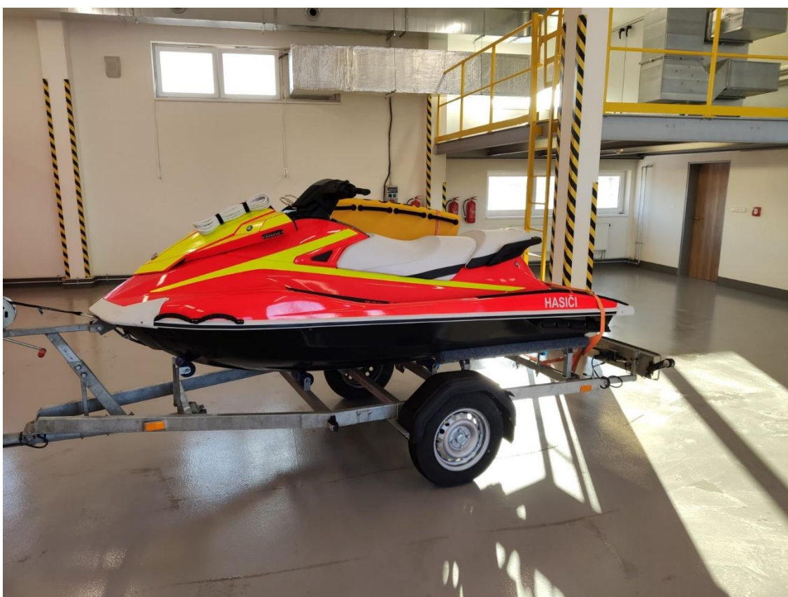
Obrázek 14 - vodní skútr s přívěsným vozíkem pro záchranu na vodní hladině

Zde je nutno konstatovat, že všichni příslušníci HZS MSK se snaží v maximální míře vyhovět všem požadavkům směřovaným ze strany města ve všech oblastech vzájemné spolupráce. Zároveň si Vážíme podpory města a doufáme ve trvalou a případně i zvyšující se finanční podpory pro náš sbor i v následujících letech. Tato podpora je pro nás významným zdrojem prostředků umožňujících realizovat investiční záměry.