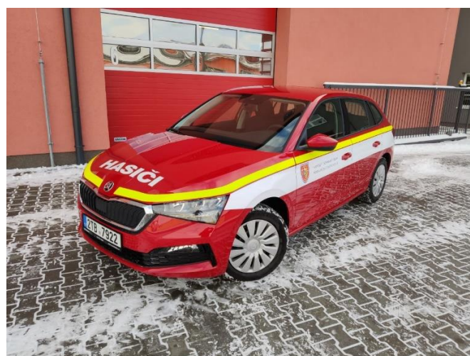
Obrázek 3 - Škoda Scala Hatchback 1,0