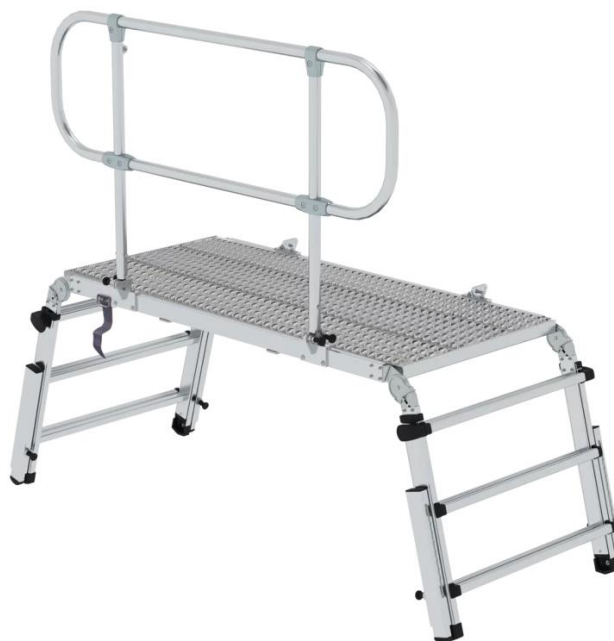
Obrázek 5 - záchranná a pracovní plošina

Používá se při záchraně osob z nákladních automobilů, autobusů a vlaků. Výškově nastavitelné nohy umožňují nasazení v členitém terénu.