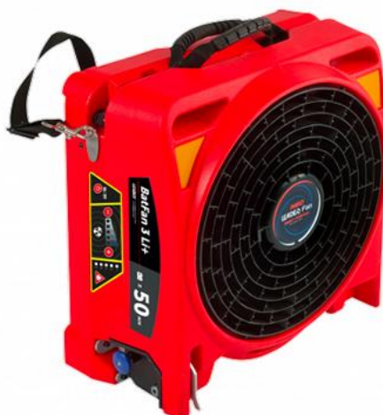
Obrázek 6 - Akumulátorový přetlakový ventilátor BATFAN 3 Li+NEO

Používá se pro přetlakové odvětrání zakouřených prostor.