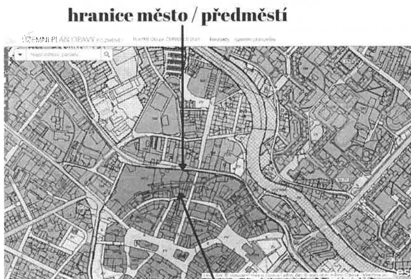
Solná 1,3, U Fortny 2

4. Pozemky leží jen několik metrů od hranice předměstí. Prosíme tedy při koupi o možnosti využití ceny za m 2 jako je u pozemků na předměstí.